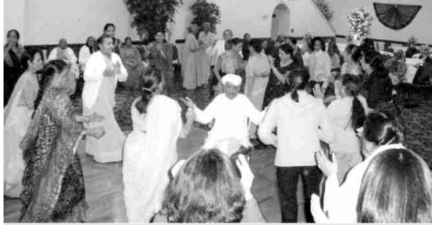
મહિદાસ દાદા નવરાસની થોડી પળો પણ મળે એટલે રાસ-ગરબા અને દુહાઓથી સંમેલન ગજવતા રહ્યા અને સિનિયર બહેનોએ તેમની ફરતે ગરબે ઘૂમીને આનંદ માણેલો.

અમૂલ્ય, અલભ્ય યોગ-આધ્યાત્મના સ્મરણોને સંગ્રહિત રાખવા મજબૂત થરની જરૂરત વેળા એજ અચાનક શાંતિભાઈ ગોંઠાના આગોતરા આયોજન રૂપે ગરમાગરમ જલેબી સાથે નારતાની પ્લેટો હાથમાં પકડાવી દીધી. બે ઘડી વડીલો છક થઈ ગયા અને ભાન ભુલી ગયા કે તેમને મધુપ્રમેહ કે બીપીની તકલીફ છે.